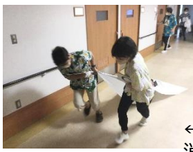
←特養での消防避難訓練の様子