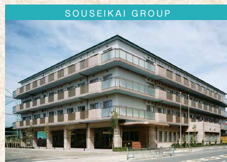
社会福祉法人 蒼生福祉会 特別養護老人ホーム 南郷の里

〒571-0016 門真市島頭3丁目1番15号 TEL 072-885-0080