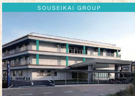
社会医療法人 蒼生会 介護老人保健施設 蒼の里

〒571-0016 門真市島頭3丁目1番15号 TEL 072-885-0080