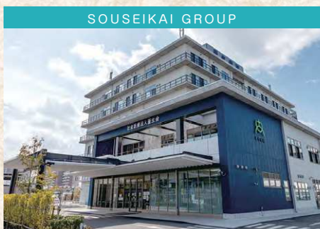
社会医療法人 蒼生会 蒼生病院